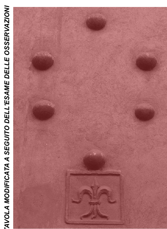
TAVOLA MODIFICATA A SEGUITO DELL'ESAME DELLE OSSERVAZIONI