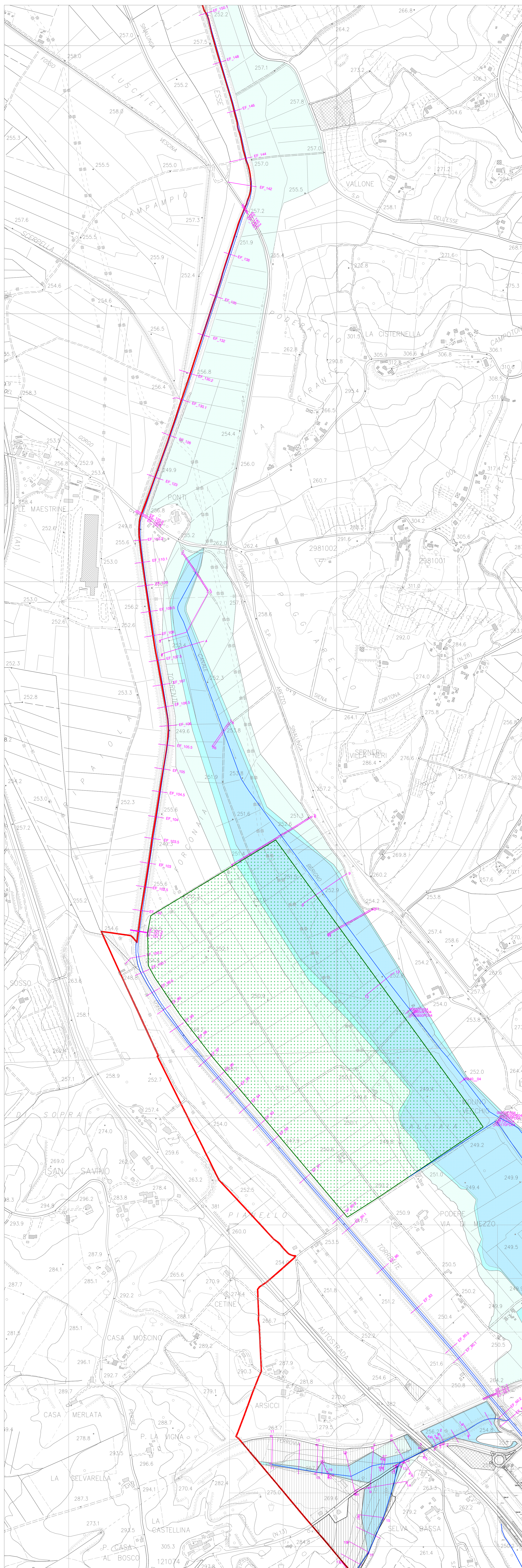
TORRENTE ESSE SECCO, BERIGNO GRANDE E BERIGNO PICCOLO