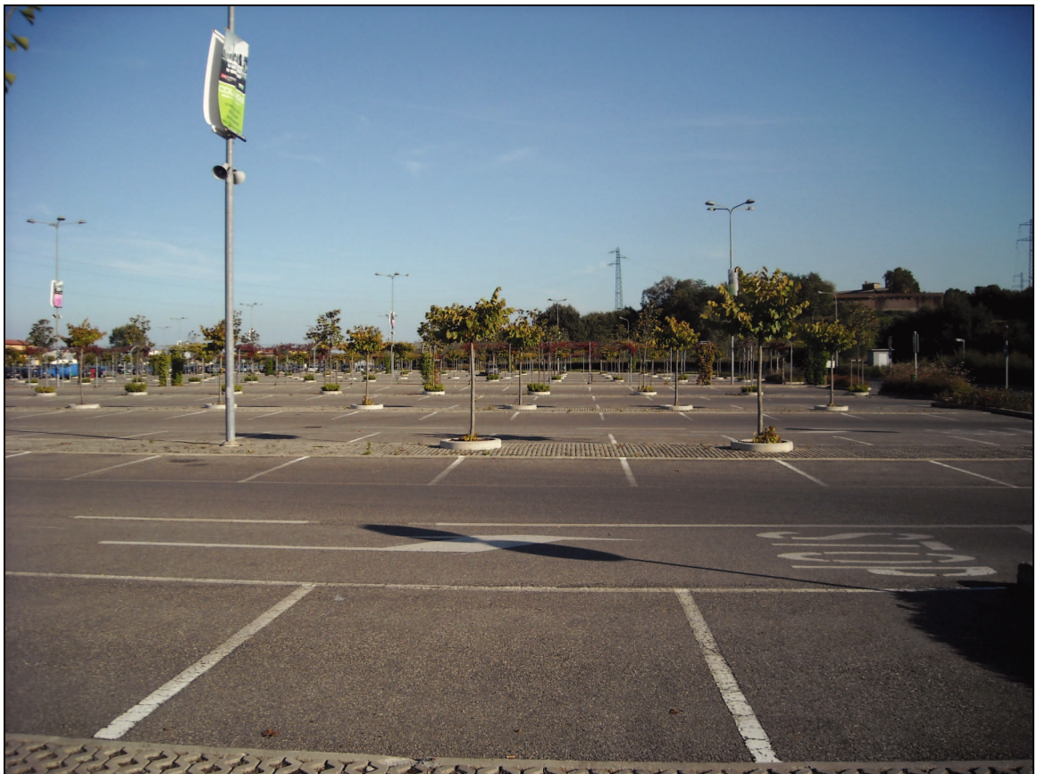
Area Attesa Popolazione: Parcheggio Outlet