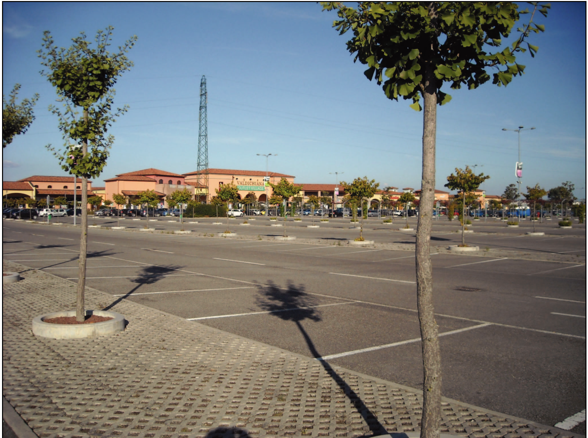
Area Attesa Popolazione: Parcheggio Outlet