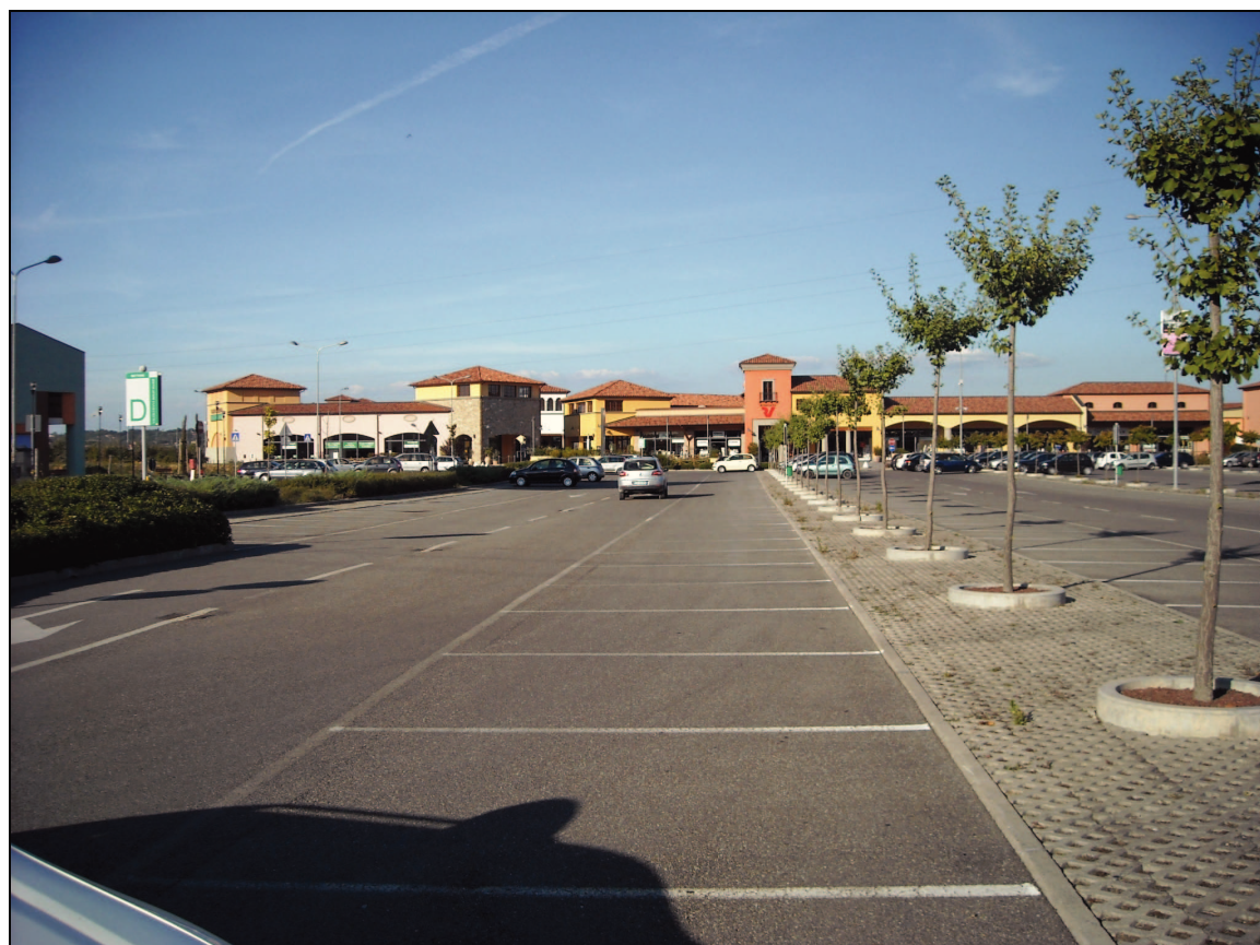
Area Attesa Popolazione: Parcheggio Outlet