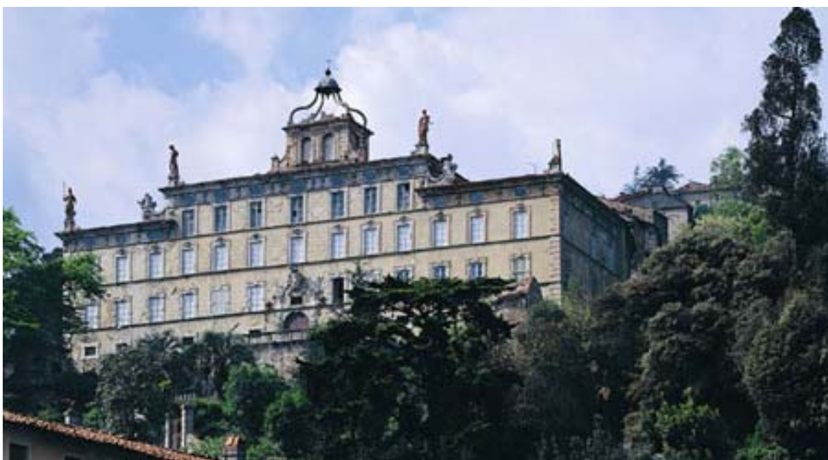
Pistoia - L'Hotel Villa Cappugi

Si chiama " Lucca insieme " ed è un piano di marketing territoriale della città di Pisa e Lucca che vuole promuoverle come un'unica destinazione turistica. L'accordo per la realizzazione del piano, che vuole accrescere, nel periodo di bassa stagione, le presenze turistiche sul territorio dei passeggeri in arrivo all' Aeroporto Galilei di Pisa, è stato firmato tra il Comune di Pisa , il Comune di Lucca e la Società Aeroporto Toscano . Per la prima volta le due città definiranno un piano di comunicazione che prevede principalmente l'impiego degli strumenti web rispondendo così al trend sempre più diffuso che vede il turista affidarsi in gran parte ad Internet per la ricerca e la scelta della propria vacanza in libertà. Il target individuato infatti è quello del turista europeo abituato a viaggiare in Europa utilizzando normalmente voli "low cost" anche per soggiorni brevi come "winter-break" o week-end lunghi.