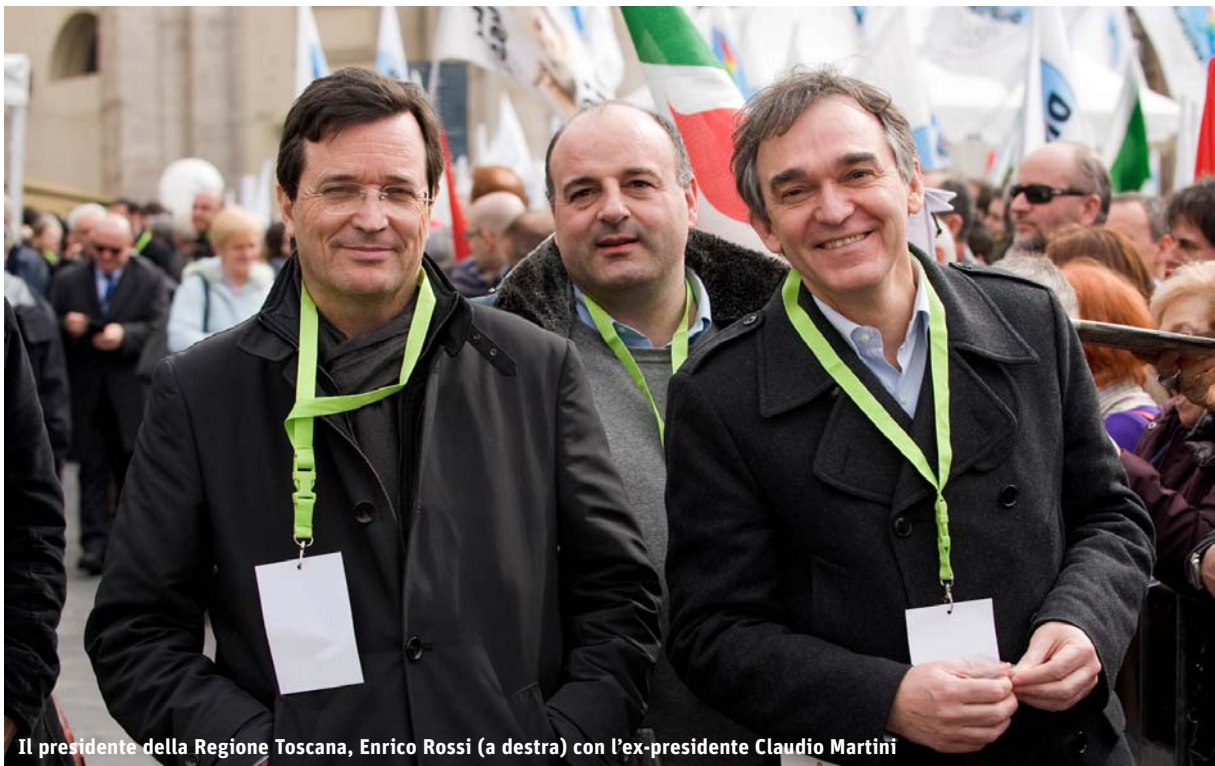
Il presidente della Regione Toscana, Enrico Rossi (a destra) con l'ex-presidente Claudio Martini

Si sta esaurendo il fondo camerale per il sostegno al credito delle imprese fiorentine. A renderlo noto è la Camera di commercio di Firenze , annunciando che le cifre stanziare negli ultimi 9 mesi (600.000 euro dal bilancio 2009 e 1.000.000 dal bilancio 2010) sono già state per gran parte consumate. Al 12 maggio 2010 la cifra erogata era pari a 1.186.680 euro, ed ha generato un finanziamento reale ed effettivo di 27.134.000 euro. Sono 292 le imprese che hanno beneficiato del contributo camerale, di cui 115 del territorio comunale di Firenze e le altre nel resto della provincia: 78 sono ditte individuali, 101 società di persone e 113 sono società di capitali o cooperative. Il settore manifatturiero ha avuto 96 finanziamenti pari al 32,88% del totale, mentre l'agricoltura 4 domande (1,37%); il resto proviene dal commercio e dai servizi.