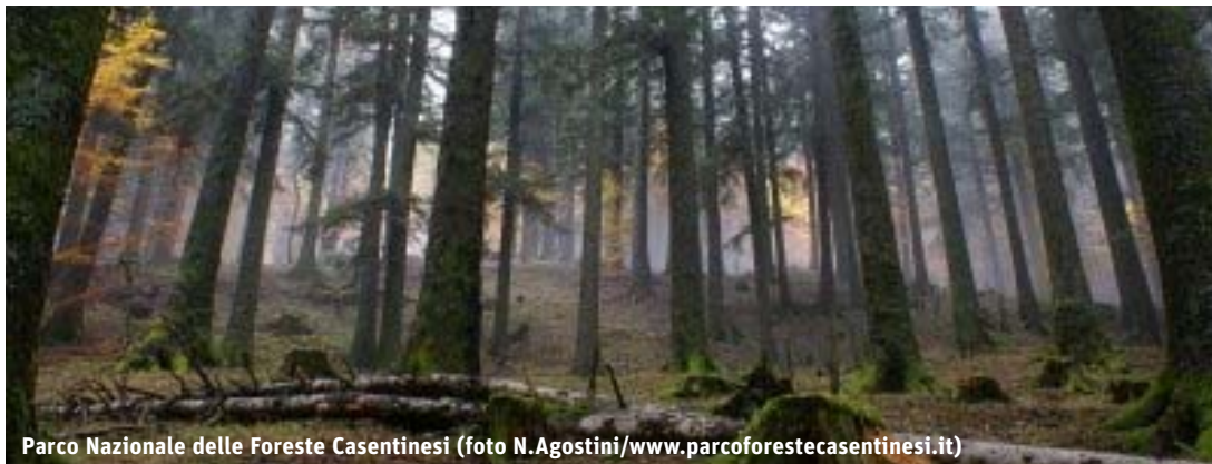
Parco Nazionale delle Foreste Casentinesi