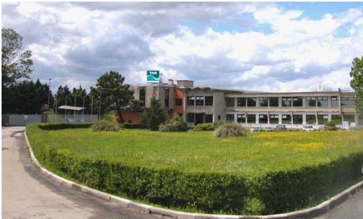
La Tabitaly di Foiano della Chiana

La Camera di Commercio di Pisa metterà a disposizione contributi a fondo perduto per gli investimenti effettuati dalle aziende pisane e da quelle che, all'interno del territorio, hanno almeno un'unità locale. Il sostegno, che potrà arrivare fino a 15.000 euro, riguarda investimenti effettuati dal 1 di gennaio, in nuovi macchinari, impianti, attrezzature, arredi ed automezzi e poi migliori tecnologie hardware e software finalizzati a rendere competitive imprese già esistenti o a farne partire di nuove. Possono accedere al bando imprenditori che abbiano fatto nuovi investimenti per almeno 5.000 euro: il sostegno riguarda il 10% dell'ammontare dell'investimento (si arriva al 15% nel caso di imprese giovanili o femminili). Presentazione domande: dal 20 maggio al 31 agosto.