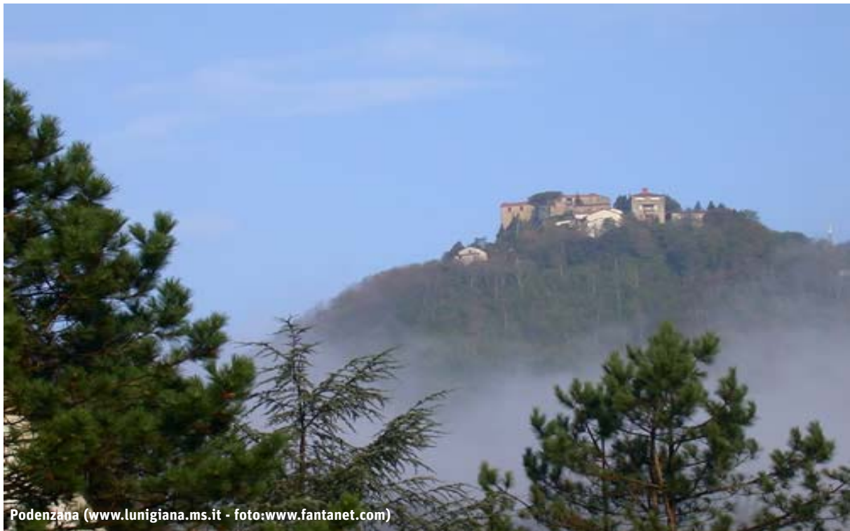
Podenzana ( www.lunigiana.ms.it - foto: www.fantanet.com )

Salvaguardare il patrimonio montano toscano grazie a 2,6 milioni di euro che andranno a finanziare la realizzazione di 62 interventi. La Regione Toscana , che ha affidato le risorse economiche a Province, Comunità Montane e alcuni Comuni , punta quindi a valorizzare e salvaguardare il patrimonio agricolo forestale regionale (42 interventi) e a controllare la vegetazione nell'alveo dei corsi d'acqua minori e della manutenzione straordinaria della viabilità forestale (20 interventi). Gli interventi sono indirizzati per la maggior parte al miglioramento delle foreste pubbliche toscane (1.132,231 euro), alla manutenzione delle infrastrutture di fruizione pubblica e quindi sentieristica, aree di sosta, rifugi e parchi faunistici (250.000 euro), agli interventi di difesa fitosanitaria (420.000 euro) ed alle sistemazioni idraulico forestali e corsi d'acqua (700.000 euro).