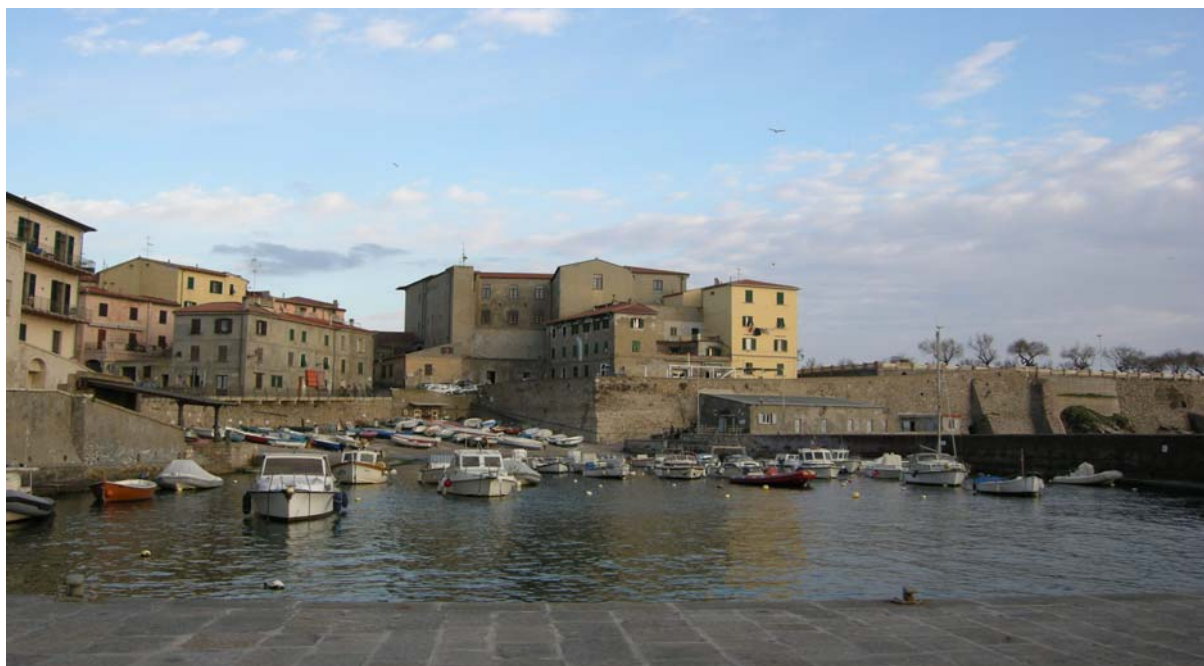
Piombino - Il Porto antico

La Provincia di Grosseto ha organizzato un workshop sulle opportunità di investimento in Tunisia e sulla linea di credito attivata dal ministero italiano degli Affari Esteri a favore delle imprese tunisine che acquistano attrezzature e servizi da imprese italiane, con l'intento di aiutare le imprese locali a trovare nuovi sbocchi commerciali all'estero. Nell'ambito della cooperazione bilaterale, l'Italia ha accordato alla Tunisia un credito d'aiuto di 36,5 milioni utilizzabile dalle imprese tunisine dei settori dell'industria, agricoltura, pesca e servizi. Esaurite queste risorse verrà attivato un altro credito d'aiuto di 73 milioni. Le imprese della provincia di Grosseto interessate a fornire impianti, attrezzature e apparecchiature alle imprese tunisine e ad effettuare investimenti in Tunisia in particolare attraverso la costituzione di imprese miste, possono richiedere di essere inserite nel catalogo curato dal Tavolo della cooperazione decentrata con la Tunisia.